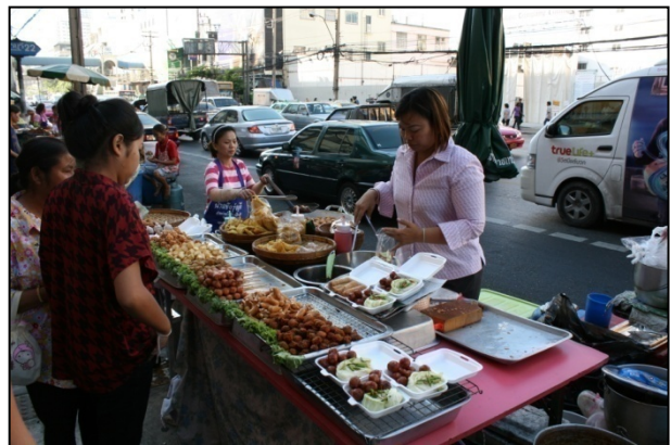
Vendeurs de rue