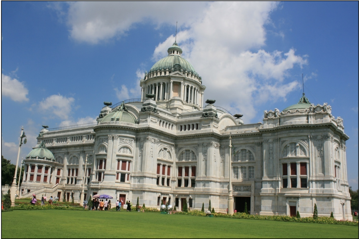
Palais royal dans le parc Dusit

Ville de tous les excès, Bangkok sait aussi vous transporter dans le Siam millénaire. En vous levant à l'aube, vous croiserez dans la ville les moines en quête d'offrandes ; à bord d'un long tail boat , vous glisserez sur les canaux à la découverte d'îlots de vie traditionnelle ; et, partout dans la ville, vous pourrez goûter aux plats délicieux proposés par les vendeurs de rue.