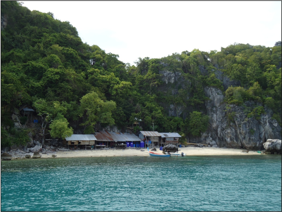
Village de cueilleurs de nids d'hirondelle au pied d'un rocher de l'archipel de Samui