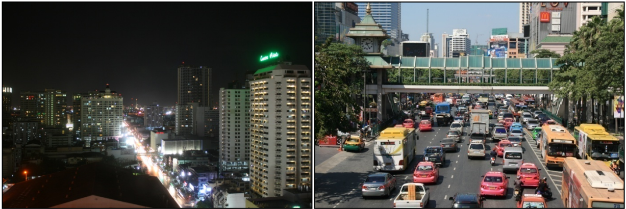
Les grandes artères embouteillées de nuit et de jour

La circulation est un véritable fléau. La pollution des véhicules et les embouteillages perpétuels sont de véritables enjeux pour le développement futur de la ville.