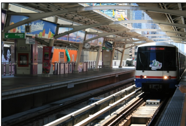
Centre commercial chic du centre-ville Train suspendu

Pourtant, derrière cette façade du 21 ème siècle, bat encore le cœur du village traditionnel qui partage le même sens du sacré et de la dévotion que n'importe quel petit village reculé du pays. Partout, des temples et des palais sublimes rappellent le bouddhisme thaïlandais et la monarchie. Même les centres commerciaux les plus modernes abritent un autel aux esprits.