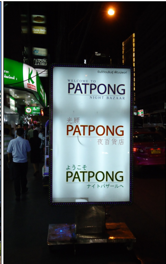
Le quartier chaud de Patpong