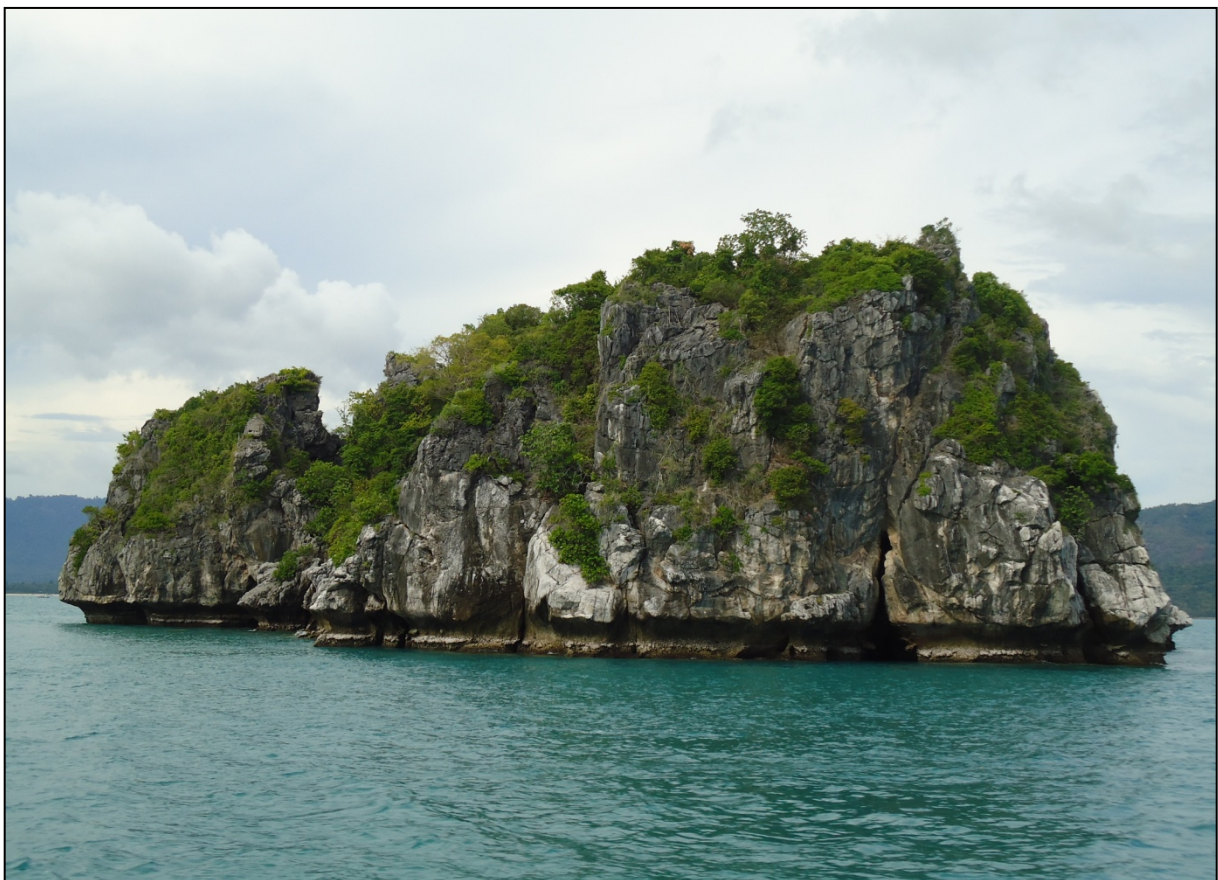
Rocher isolé dans l'archipel de Samui

Les cueilleurs restent souvent sur les sites durant toute la période de récolte. Ils habitent à plusieurs dans des habitations de fortune installées sur les flancs des rochers.