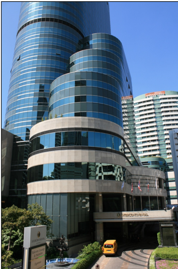
Les gratte-ciel du centre-ville