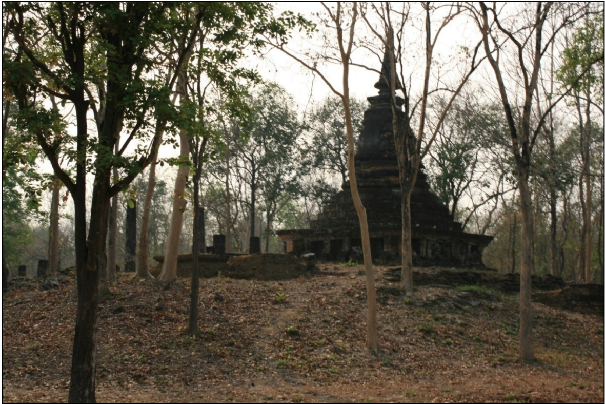
Ce temple arbore un stupa dont la base est ornée d'éléphants sculptés.