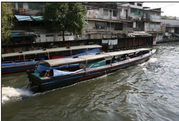
Long tail boat

Ville de tous les excès, Bangkok sait aussi vous transporter dans le Siam millénaire. En vous levant à l'aube, vous croiserez dans la ville les moines en quête d'offrandes ; à bord d'un long tail boat , vous glisserez sur les canaux à la découverte d'îlots de vie traditionnelle ; et, partout dans la ville, vous pourrez goûter aux plats délicieux proposés par les vendeurs de rue.