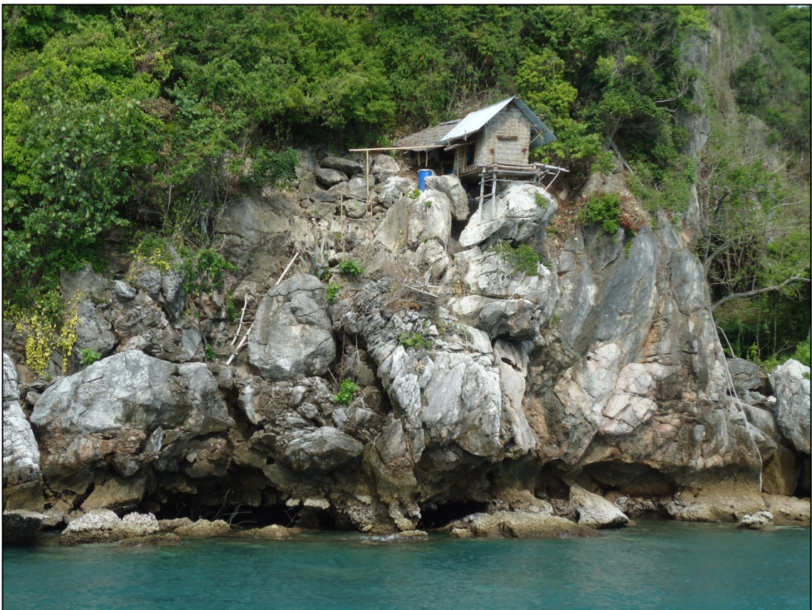
Habitation sommaire suspendue de cueilleurs de nids d'hirondelle